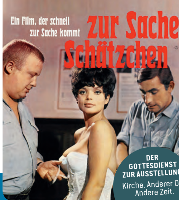
Filmplakat „Zur Sache Schätzchen. Ein Film, der schnell zur Sache kommt.“

DER GOTTESDIENST ZUR AUSSTELLUNG: Kirche. Anderer Ort. Andere Zeit.