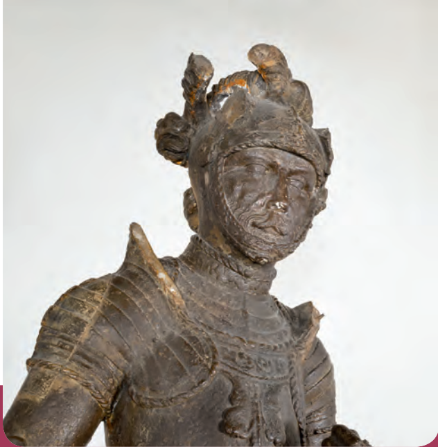
Steinstatue, ehem. Marktbrunnen Balingen, 16. Jhdt.