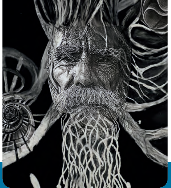
„Metarmorphose“, Lars Bänsch, Kohlezeichnung

Vernissage mit Grußworten des Oberbürgermeisters und der Schulsprecher, dazu Gesang und Klavier des Schulchors und eine Performance der Theater-AG