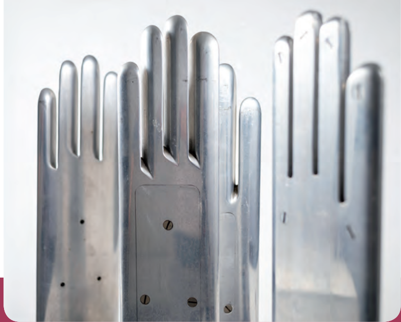
Dressierreisen, um 1950